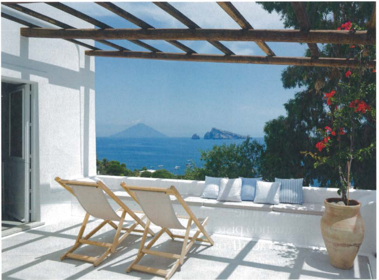
Sopra, il terrazzo della villa con vista sull'isola di Stromboli. Sotto, a destra, la cucina con piastrelle antiche bianche e blu, profilate di cemento. Nella pagina accanto, la camera da letto matrimoniale e due scorci dell'esterno.